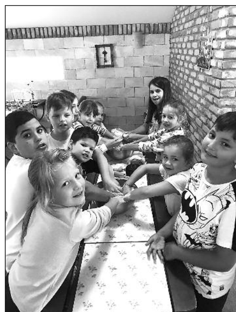
Az EtyekVin nyári táborának résztvevői