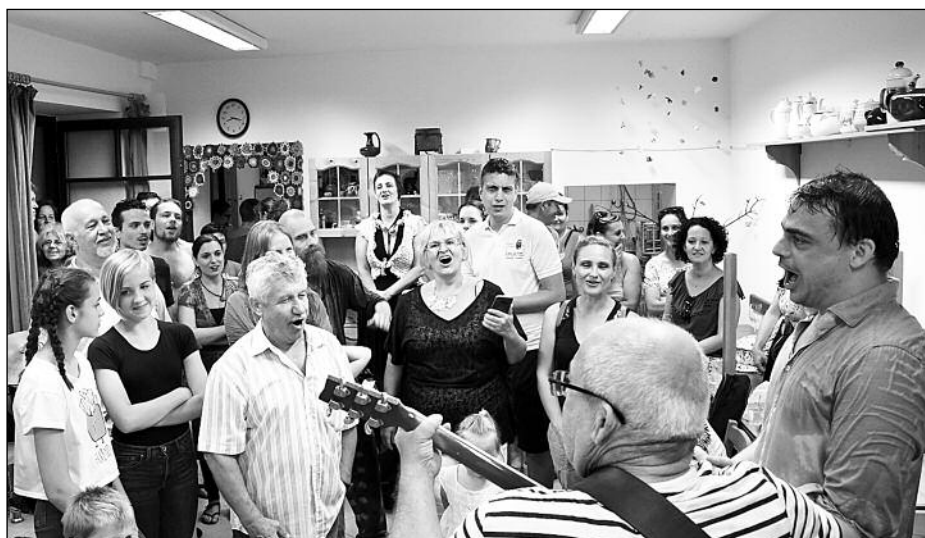
Egy órára bekergette az eső a 8. Szobazenész találkozó résztvevőit a „szobába”, ahol esődalokkal próbáltuk jobb belátásra bírni az időjárást. Sikerült.