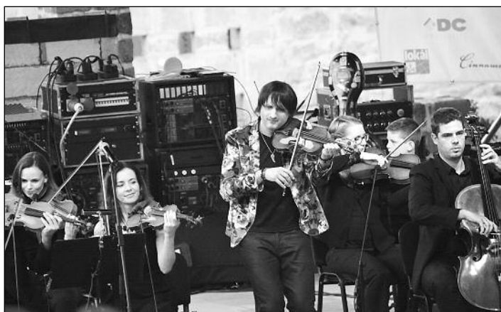
A „Péntek esték” programsorozat első sztárvendége Edvin Marton és zenekara volt a Haraszthy Pincészet újonnan épült amfiteátrumában