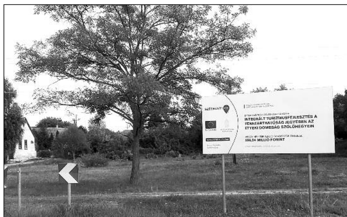
Valami elindult. Uniós támogatással épül Látogatóközpont a Demján Pince alatti zöldterületen