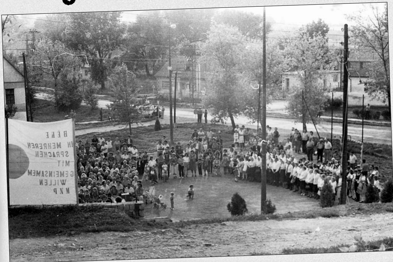
Nemzetiségi találkozó a bitumenes pályán