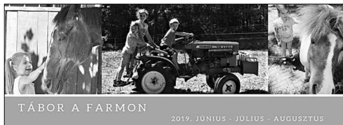
TÁBOR A FARMON

2019. április 30-ig Early Bird kedvezmény – Testvérkedvezmény: 10%