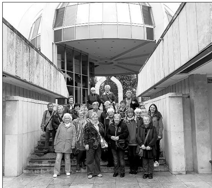
A Segítő Kéz nyugdíjasai Mohácson kirándultak