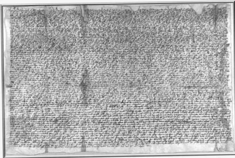
Veszprémi Főegyházmegyei Levéltár eredeti, latin nyelvű oklevele

A fehérvári káptalan 1327. évi — ma már hiányzó — átírásából Szécsi Miklós országbíró 1383. máj. 16-i oklevelében tartalmilag átírva. — Vk. m. lt. Kálóz 9.