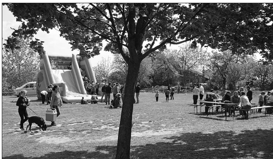
Kispályás focibajnokság, sportversenyek, ugrólóvár, virsli, és a a Borostyán Nyugdíjas Klub tagjai által sült lángos várta a majálistozókat a Molnár Béla Sportcentrumban május elsején