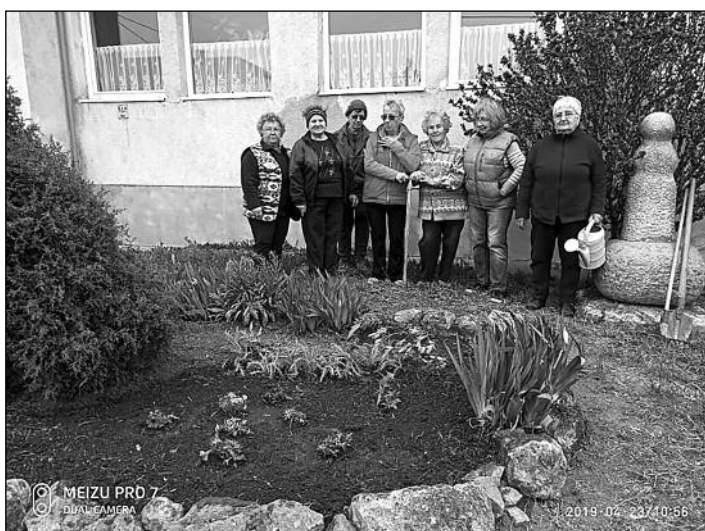
A Borostyán Nyugdíjas Klub tagjai – mint minden évben – idén is elvégezték a tavaszi munkálatokat az orvosi rendelő előtti virágoskertben