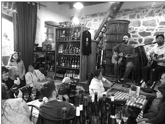
Teltházás KODACHROME koncert az esős Etyeki Borangolón a Nádas Pincében