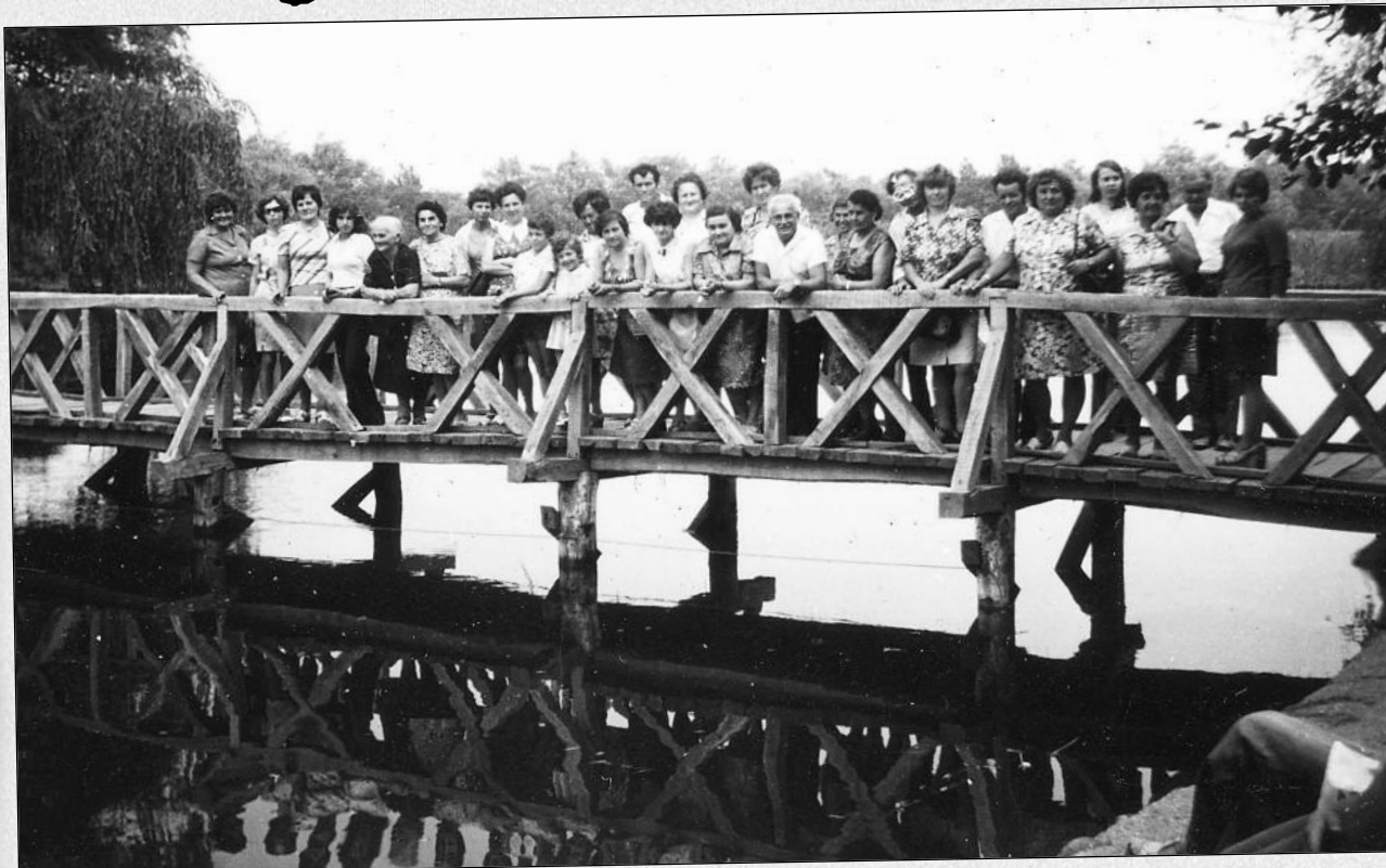
Kirándul a női kórus 1960-ban