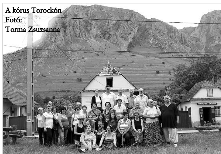
A kórus Torockón