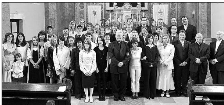
Bérmálkozó a római katolikus templomban Spányi Antal püspökkel.

A reptérről Kreisz György (Kossuth L. u.) ingyen hozta el kisbuszával az énekeseket, mondván, ezzel szeretné támogatni