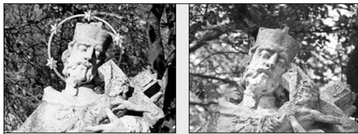
Különbégkereső: rongálás előtt és után

Tesztüzem nem volt, de tervezői garanciát, nyilatkozatot kaptunk arra, hogy a minőség javulni fog. Reméljük kellemesen fogunk csalódni. Novemberre szeretnénk végezni a cseréket, lesz benne lámpabővítés is, ill. ahová szükséges és csak há-