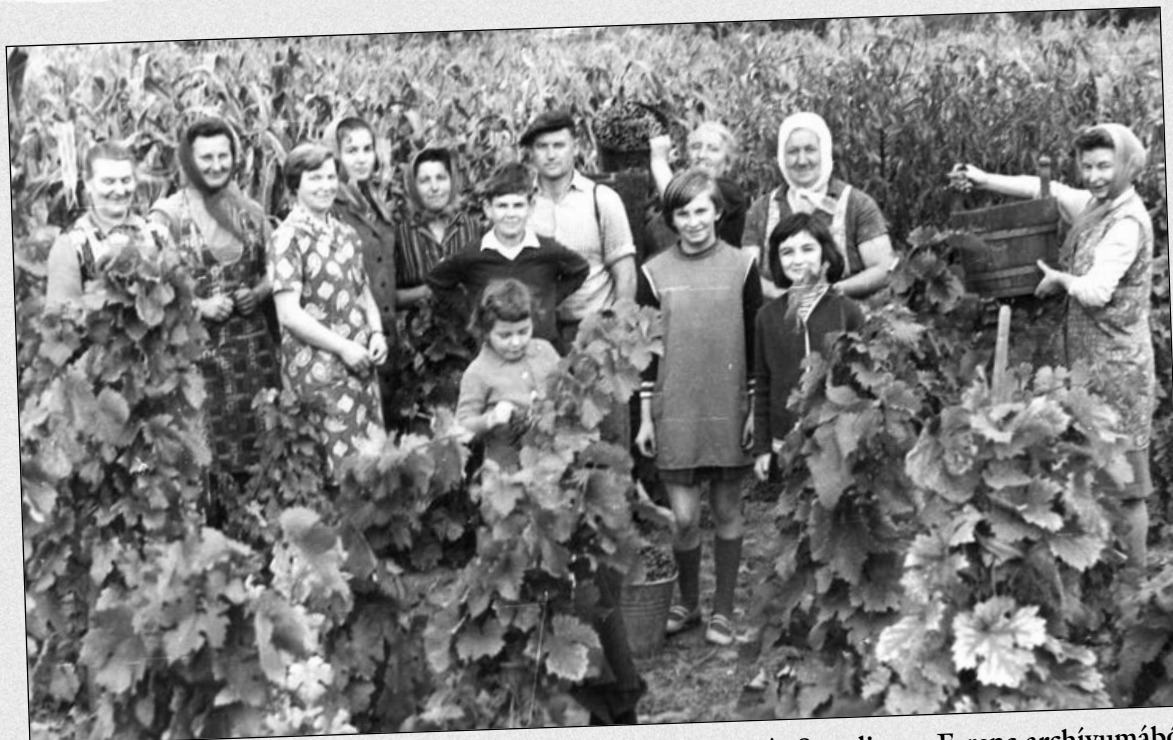
Szüret a hatvanas években