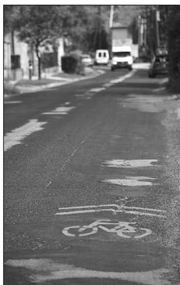
A belterületi utakra csak „buzgalomból” került festés