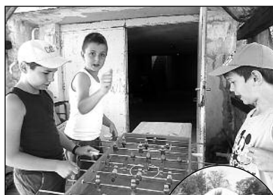
Képek a napközis tábor első turnusáról