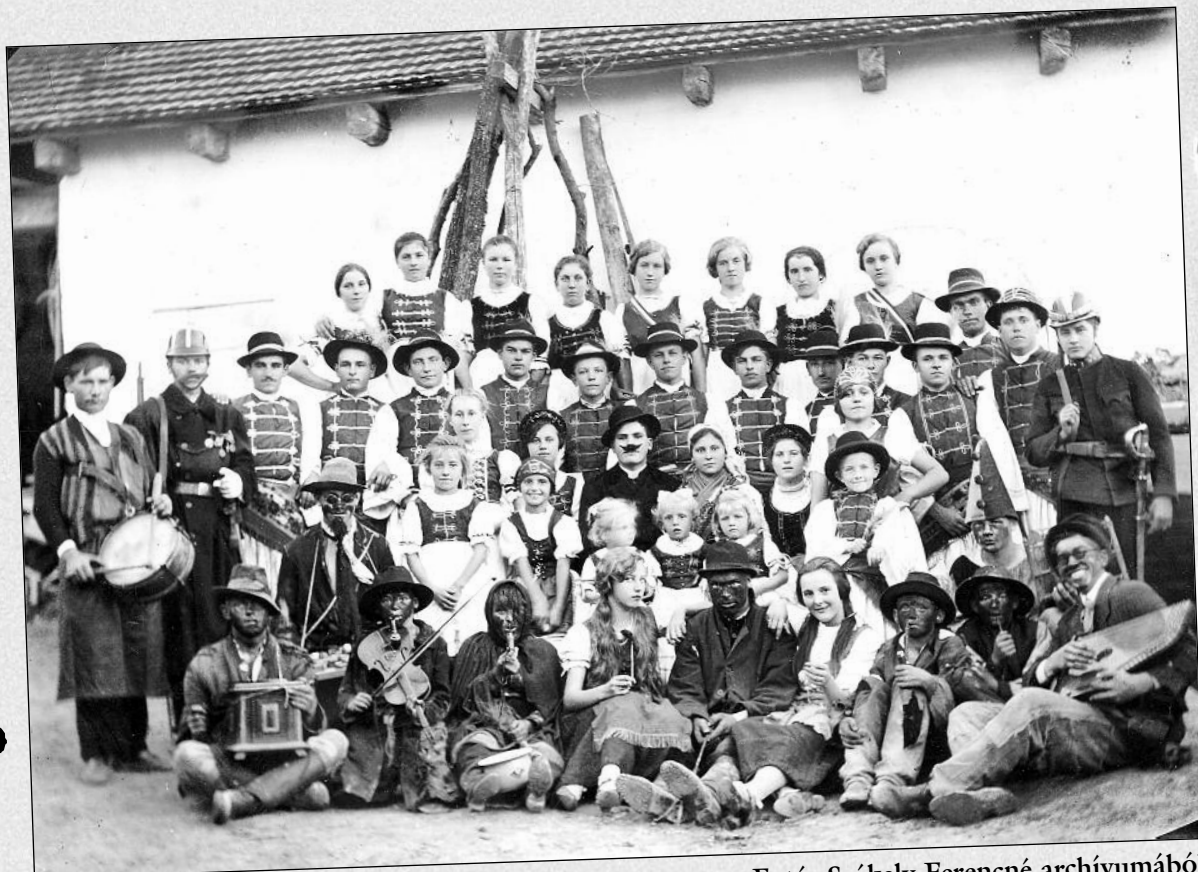
Szüreti felvonulás résztvevői 1931-ben